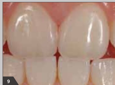
9 Готовая реставрация передних зубов