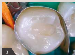
3 Восстановление дентина путем послойного наложения опакующей дентиновой массы