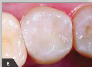
6 Вид готовой реставрации после окончательной обработки (вид с окклюзионной поверхности)