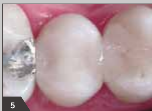
5 Вид готовой реставрации после окончательной обработки (вид с вестибулярной стороны)