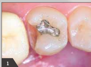
1 Исходная ситуация - окклюзально-дистальный дефект амальгамовой пломбы зуба 45