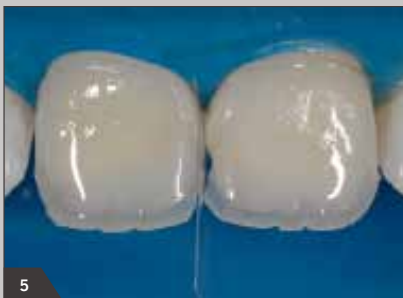
5 Моделирование дентина и мамелонов с помощью Амариса O1