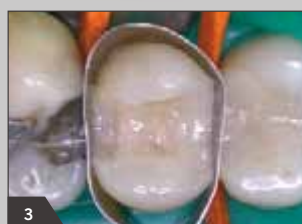
3 Восстановление дентина путем послойного наложения опакующей дентиновой массы