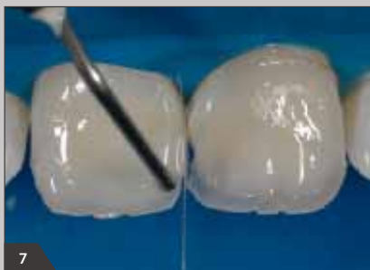
7 Моделирование режущего края с помощью высокопрозрачного оттенка Амариса (НТ)