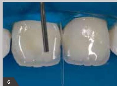
6 Придание естественного цвета мамелонам благодаря легкому окрашиванию с помощью Амариса Флуор (НО)