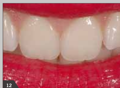
12 Естественная реставрация передних зубов