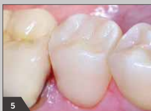
5 Вид готовой реставрации после окончательной обработки (вид с вестибулярной стороны)