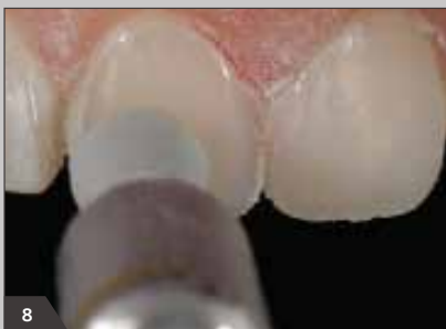
8 Полировка реставрации до сухого блеска