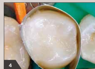
4 Нанесение прозрачного эмалевого оттенка в качестве завершающего слоя