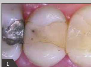
1 Исходная ситуация - окклюзально-дистальный дефект амальгамовой пломбы зуба 35