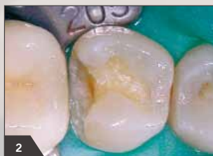
2 Наложение коффердама, устранение остатков амальгамовой пломбы. Ситуация после полной экскавации