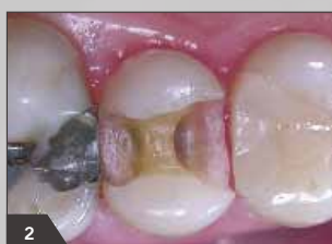
2 Препарирование полости, наложение коффердама, устранение остатков амальгамовой пломбы. Ситуация после полной экскавации