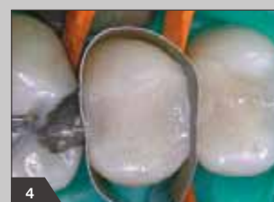
4 Нанесение прозрачного эмалевого оттенка в качестве завершающего слоя