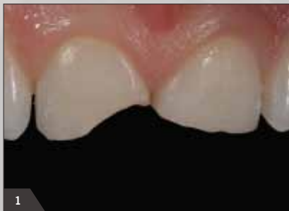
1 Исходная ситуация – дефект режущего края зуба 11 и зуба 21