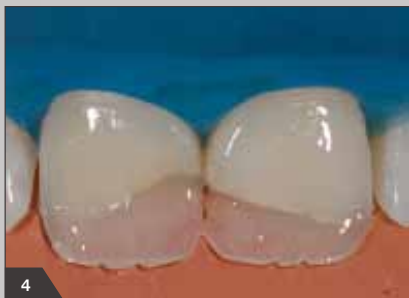
4 Нанесение оттенка TL («светлая эмаль») системы Амарис для реконструкции эмали с небной стороны