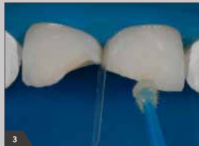
3 Аппликация адгезива