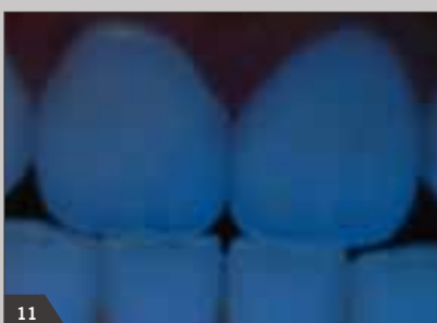
11 Флюоресценция реставрации соответствует флюоресценции естественных зубов