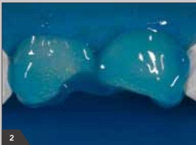
2 Обработка твердых тканей зуба 37-процентным раствором фосфорной кислоты