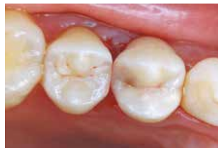
Готовая реставрация из Полофил Супра